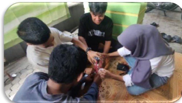
Gambar 2. Kolaborasi dan interaksi dalam kelompok