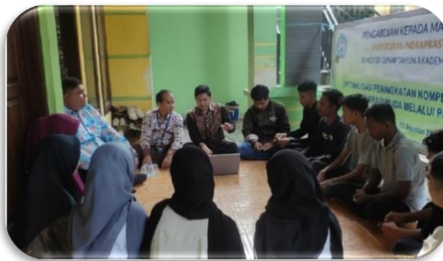
Gambar 1. Sesi ceramah dan diskusi penyampaian materi

Sinergi antara tim pelaksana dan Karang Taruna inilah menjadi kunci mencapai dampak signifikan dan berkelanjutan, memastikan program berjalan efektif dan sesuai dengan kebutuhan riil peserta.